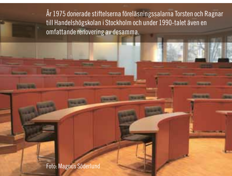
År 1975 donerade stiftelserna föreläsningssalarna Torsten och Ragnar till Handelshögskolan i Stockholm och under 1990-talet även en omfattande renovering av desamma.